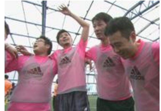
社員旅行の復活や運動会の取り組み (※2014年11月11日放送ガイアの夜明けより)